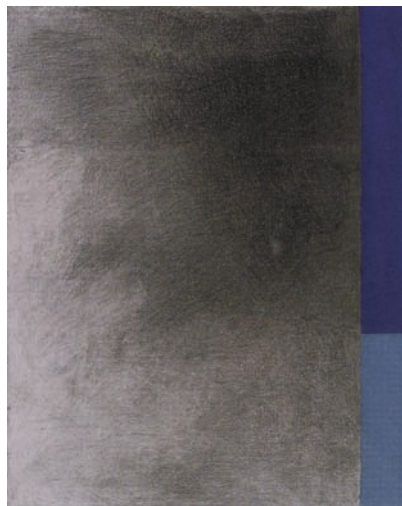
青木 洋子 1944 坂城町出身 上田市在住

1990 「平面としての絵画・絵画としての平面」(東京) 2000 「波動1999～2000」(横浜・光州) 2007 国際現代美術光州アートビジョン展(韓国・光州) 2009 韓国現代美術展(韓国・釜山) 2012 第一回ジョンジュ・ピエンナーレ展(韓国) 2014 上田現代美術展(スタジオ・ミル) 上田市 日越現代美術展2014「1+6 IN HCMC」 (ホーチミン市美術博物館・ベトナム) 2015 上田・横浜現代美術展(スタジオ・ミル) 上田市 1982・84・86・88 日本国際美術展 現代日本美術展