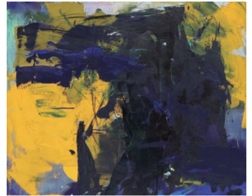
村中 歩 1982 奈良県出身 上田市在住

1985 6人展(他、版画展3回) 東京 2005 3人展(シロタ画廊・東京) 2007～2012 韓日現代美術展(韓国・ソウル) 2008～2014 temoin展(ギャラリー向日葵・東京) 2014 日越現代美術展2014「1+6 IN HCMC」 (ホーチミン市美術博物館・ベトナム) 2012～2015 「点の解」展(横浜市民ギャラリー)